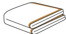
薄いブランケット